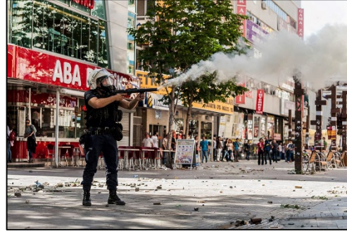
Şekil 2. Kızılay Meydanı & Yüksel Caddesi, Ankara, 01.06.2013