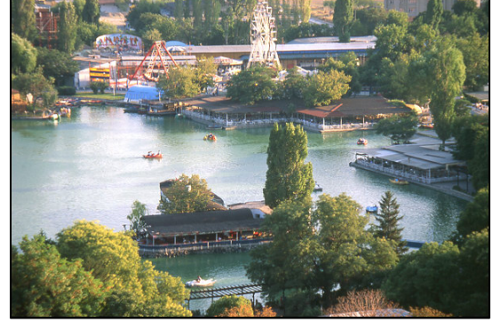
Şekil 1. Ankara Gençlik Parkı: Kurgulanan nedir?... Algılanan ve deneyimlenen nedir?